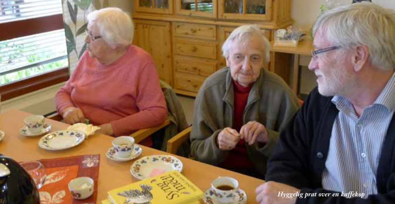
Hyggelig prat over en kaffekop

I hvert nummer av menighetsbladet vil vi presentere en gren av virksomheten her i Borgestad menighet. Denne gangen gir vi et lite glimt av: