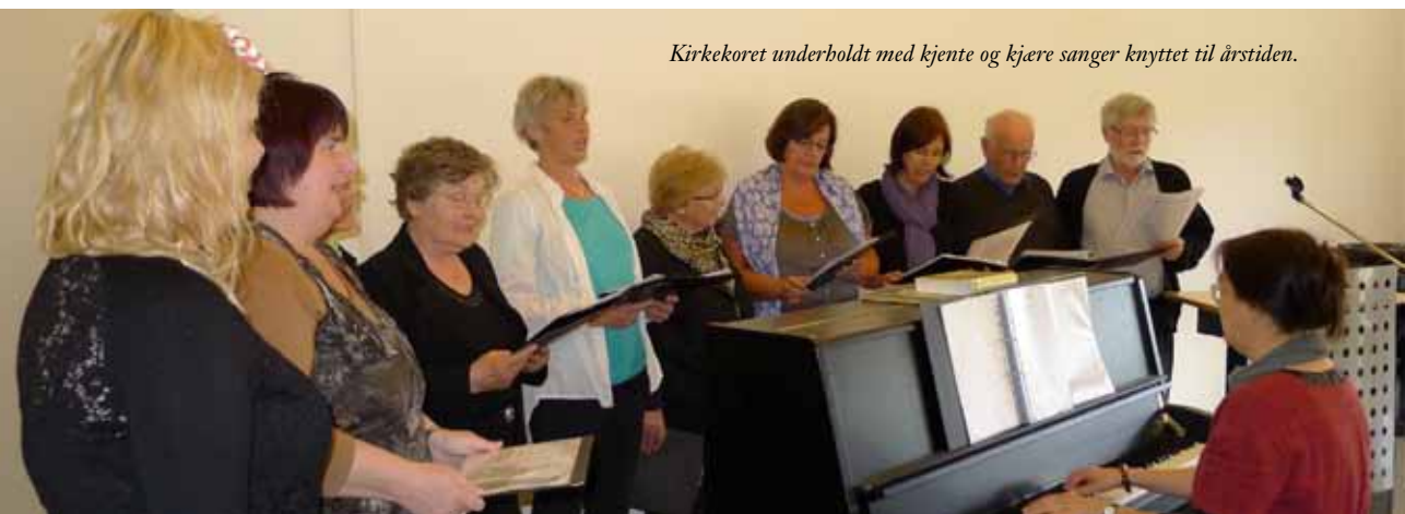
Kirkekoret underholdt med kjente og kjære sanger knyttet til årstiden.