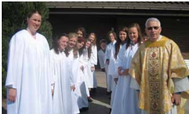
Bilde fra fjorårets konfirmanter i Borgestad kirke.

Ring 815 33 300 eller skriv en SOS-melding via www.kirkens-sos.no